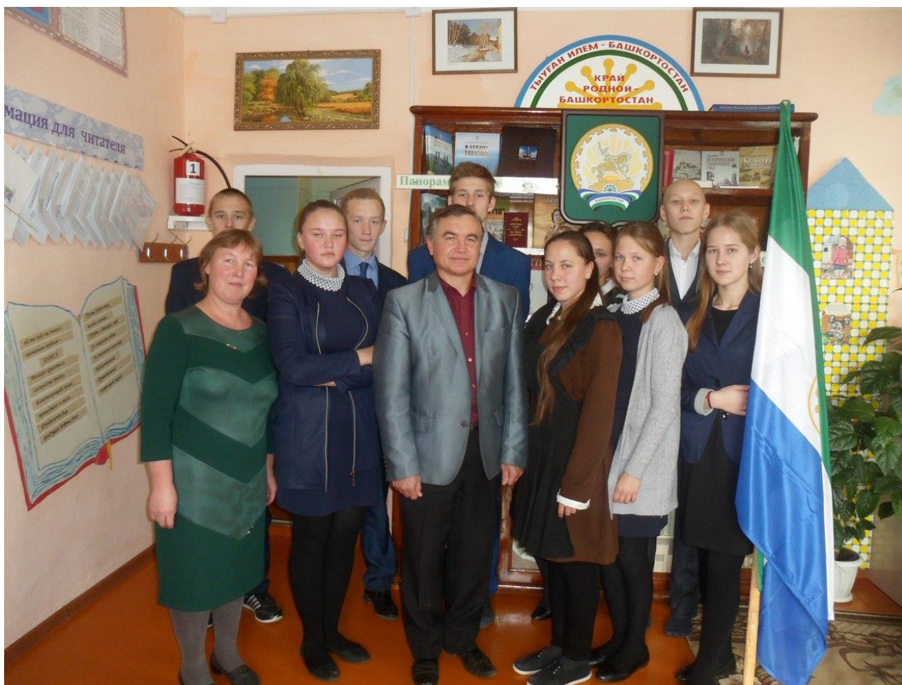
Мероприятие в сельской библиотеке.